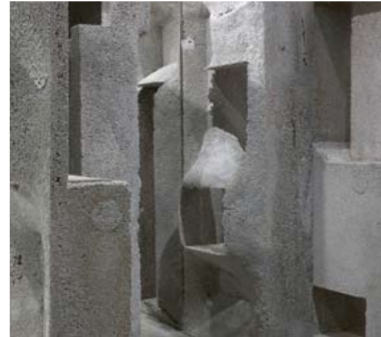
Detailansicht des Materials