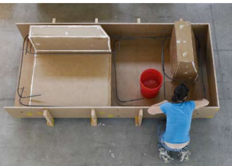
Die Komplettierung der Formen: Bewehrungen und Formentrennmittel