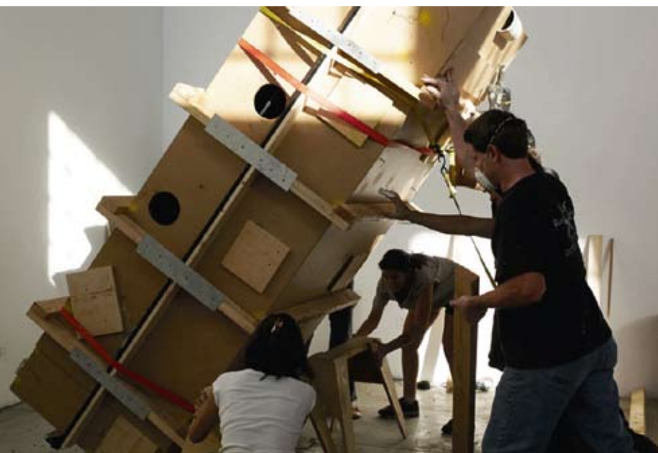
... und zwischen den Schalungselementen positioniert.