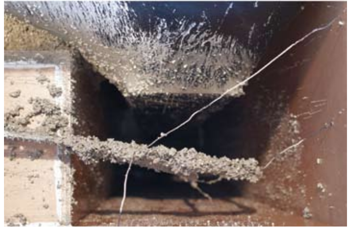
Die Objekte werden gefüllt ...