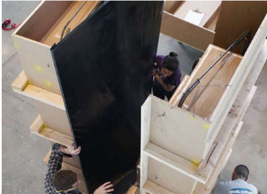
Die flexible Haut wird auf einen Rahmen gespannt ...

Die Projektliste des Büros von Architektin Susanne Zottl weist schwerpunktmäßig Bauten im Kontext bestehender Strukturen und denkmalgeschützter Objekte aus. Denkmalpflegerische Vorgaben definieren den gestalterischen Rahmen von Zu- und Umbauten insofern, als sämtliche baulichen Veränderungen des Objektes klar als zeitgenössischer Eingriff ablesbar und die ursprüngliche Erscheinungsform des Denkmals rückführbar sein sollen. Diese Forderungen jedoch „frieren“ das Denkmal in einer bestimmten – und zufälligen – Zeitperiode ein.