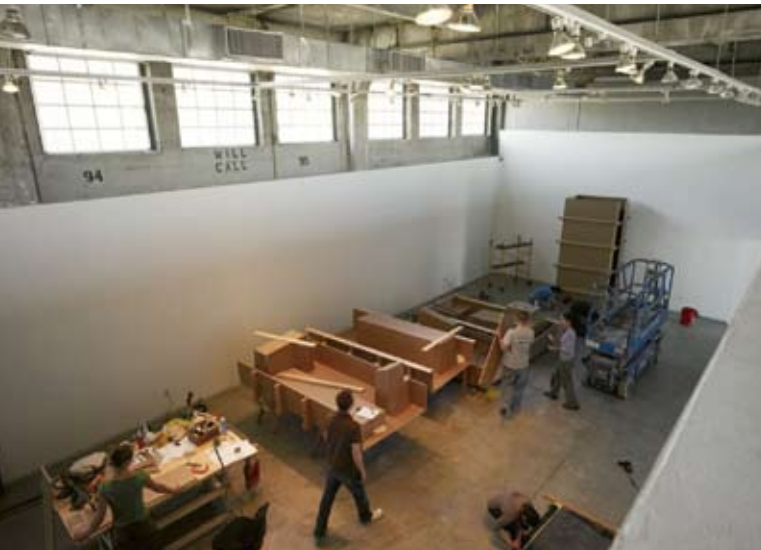
Der Ausstellungsraum dient auch als Arbeitsraum.

Der Einladung des Southern California Institute of Architecture (SCI-Arc) in Los Angeles/USA folgend gestaltete das Büro von Architektin Susanne Zottl eine standortspezifische Installation im Ausstellungsraum der Universität (Gallery).